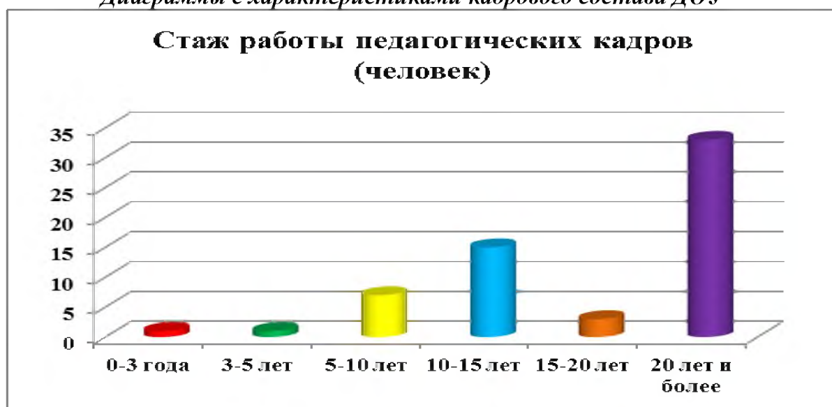
Диаграммы с характеристиками кадрового состава ДОУ

Курсы повышения квалификации в 2019 году прошли 28 человек (из числа педагогов и административного состава).